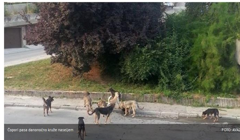
Čopori pasa danonoćno kruže naseljem